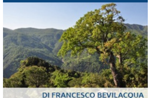
DI FRANCESCO BEVILACQUA